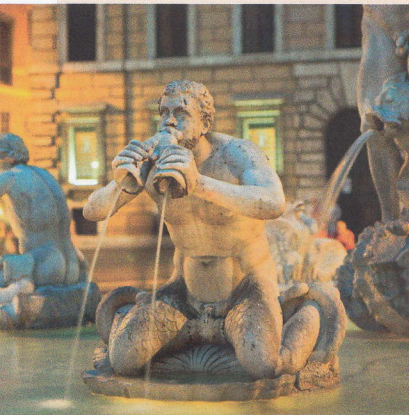
Jos: Fântâna Maurului, Piazza Navona

Un rafinat colecționar de artă, cardinalul Scipione Borghese (1579–1633) a construit pe Colina Pincio un palat special în care să-și adăpostească capodoperele adunate cu patimă de-a lungul anilor. Astăzi Galeria Borghese deține mai multe sculpturi semnate de Bernini, maestrul barocului, dintre care se remarcă Răpirea Proserpinei și Apollo și Dafne , o ilustrare tulburătoare