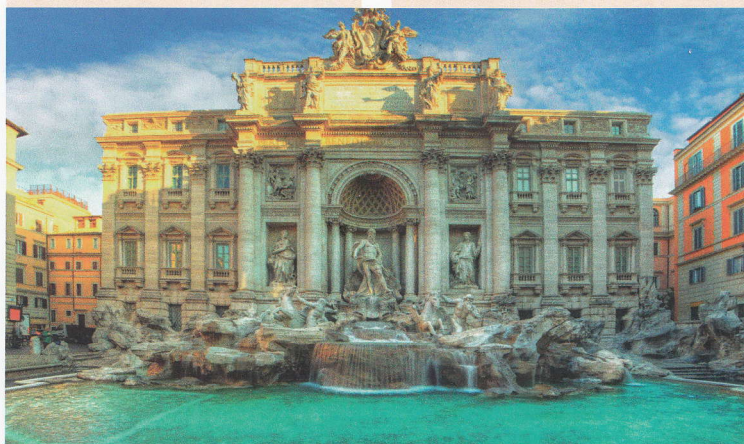
Foto: Fontana di Trevi

Dacă doriți să îl vedeți pe Papă și să îi primiți binecuvântarea, participați la ceremonia cu durata de aproape 2 ore care are loc în fiecare miercuri, la ora 10:30, în Piazza San Pietro (mai puțin în luna august și iarna, când este mutată în Aula Paolo VI). Aceasta nu este propriu-zis o slujbă, dar include rugăciuni, cântece, o scurtă predică și binecuvântări în mai multe limbi; accesul este gratuit, însă este necesar să faceți programare din timp pe site-ul www.papalaudience.org . Papa se arată mulțimii și duminica, la ora 12, la fereastra apartamentului său (sau la cea a reședinței estivale de la Castel Gandolfo, în lunile iulie și august), pentru a ține o mică predică, urmată de rugăciunea Angelus (sau Regina Coeli ) și binecuvântarea apostolică, rostită în mai multe limbi. Pentru această ceremonie, cu durata de circa 20 minute, nu este nevoie să faceți rezervare.