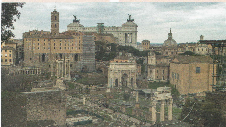
Foto: Vedere din Palatin spre Forul Roman și Campidoglio

Râuri de sânge au curs de pe arena Colosseum-ului de când a fost inaugurat în anul 80 ca Amfiteatrul Flavian până în 523, când ecoul luptelor cu gladiatori, spectacolelor de amploare care reconstituiau lupte celebre și naumahii (bătălii navale) și execuțiilor nemiloase s-a stins definitiv. În Evul Mediu, plăcile de marmură i-au fost smulse brutal pentru construirea palatelor romane, dar, în ciuda jafurilor repetate, carcasa sa a supraviețuit invincibilă ca o mărturie a eternității Romei. De altfel, în secolul al VIII-lea, călugărul și istoricul Bede Venerabilis a consemnat într-o epigramă rămasă celebră următoarea profeție: „Cât timp Colosseum-ul va rezista, și Roma va rezista; atunci când Colosseum-ul va cădea, va cădea și Roma; iar când Roma va cădea, cu ea se va prăbuși întreaga lume.”